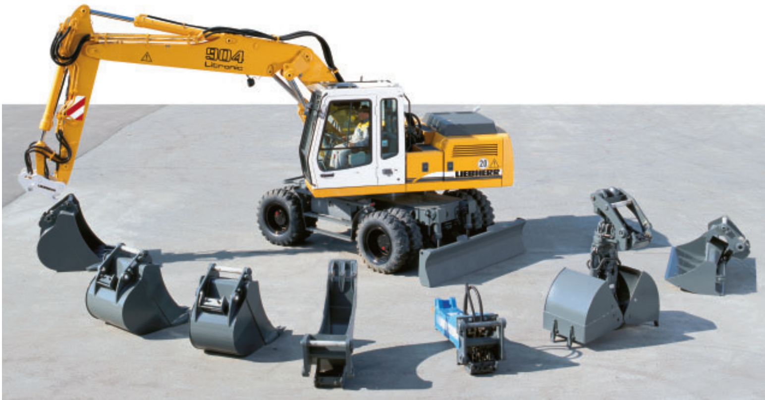
Mechanisch und hydraulisch mit der Ausrüstung verbunden.