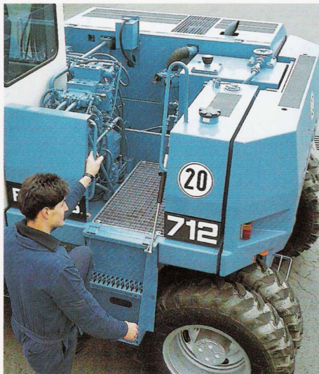
Seitlicher Aufstieg auf begehbare Wartungsplattform mit guter Zugänglichkeit zu den Hydraulik-Aggregaten.