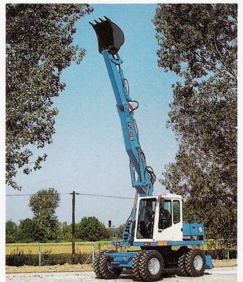
Überzeugend: Die weite Ausladung des Auslegers.