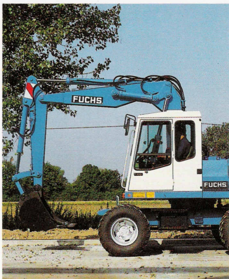
Auslegerposition für Straßentauglichkeit nach StVZO.