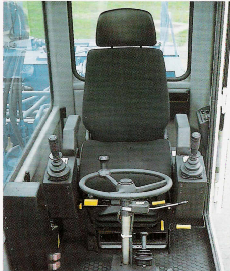
Komfort-Arbeitsplatz mit Panorama-Aussicht und moderner Armaturen-Konsole.

FUCHS-Maschinen sind Spezialisten mit Spürsinn. Sie sind in der harten Praxis des Alltags seit Jahrzehnten bewährt.