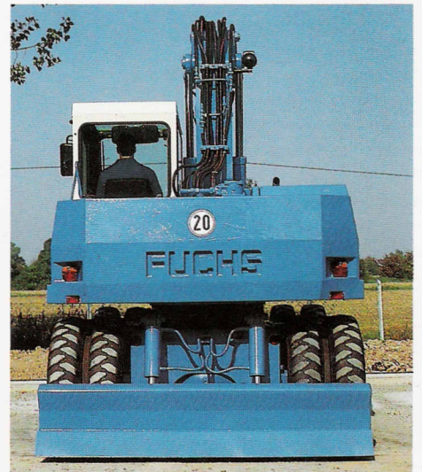
Kompakte Abmessungen werden unterstützt vom kräftig dimensionierten Planierschild.