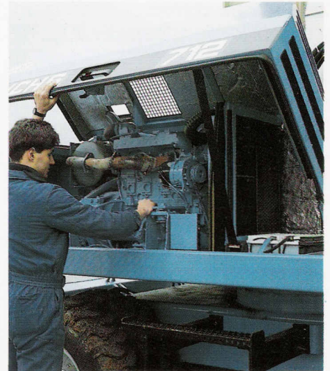
Alle Servicearbeiten sind bequem zu erledigen.