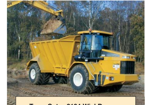
Terra-Gator 2104 Wiel Dumper