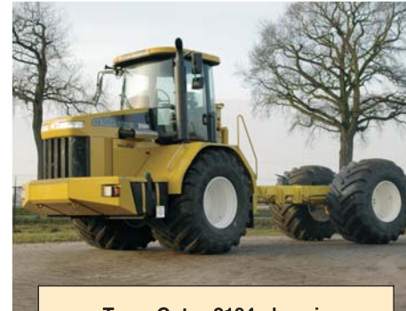
Terra-Gator 2104 chassis

Reeds meer dan 10 jaar uw specialist voor multifunctionele toepassingen