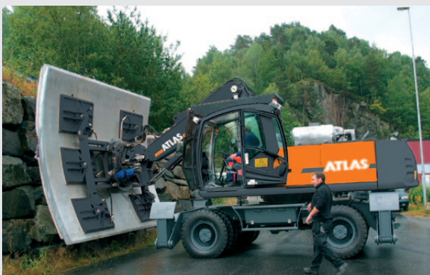
Handhabung von Tunnelrohrschalungen mittels Vakuumanlage mit 22 to ATLAS Mobilbagger