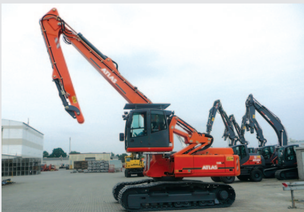
Grungerät 340LC: Spezialraupenbagger mit 2,5 m hoch- und vorfahrbarer Vario-Kabine und gestrecktem Monoarm. Der Bagger wird zur Uferbefestigung an der Küste eingesetzt, deshalb hat er eine Seewasserbeständige Lackierung erhalten und alle Zylinderkolbenstangen sind aus Ni-Ro Vollmaterial in unserem Werk in Vechta gefertigt.