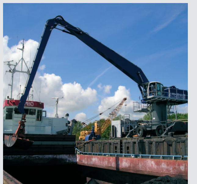
Schiffsendladung mit einem ATLAS Mobilbagger, ausgestattet mit Turmerhöhung und einer Wartungsbühne.